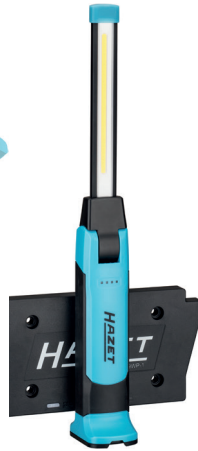
Kabellos / Wireless