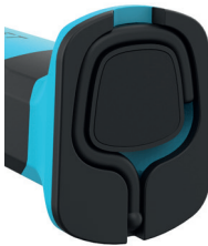
Magnet / Magnet