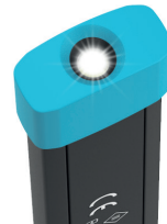
Top Licht / Top lamp