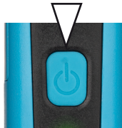
Stufenlos Dimmbar / continuously dimmable