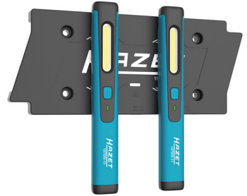
Kabellos / Wireless