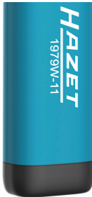
Magnet / Magnet