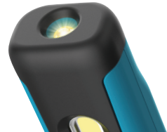
Top Licht / Top lamp